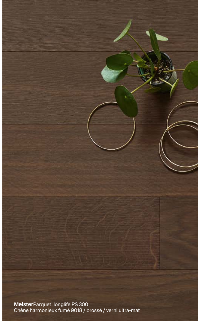
MeisterParquet. longlife PS 300 Chêne harmonieux fumé 9018 / brosse / verni ultra-mat

Peu importe qu'il soit huilé ou verni ultra-mat : un parquet requiert des produits d'entretien spécialement adaptés à ses propriétés. Vous garanzissez ainsi que votre sol reste beau longtemps et que le film protecteur de la surface reste en parfait état. Vous trouverez tous les produits et conseils concernant le nettoyage et l'entretien à l'adresse www.meister.com/fr/conseil/entretien.html